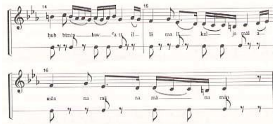
譜 1：穆瓦莎赫 6